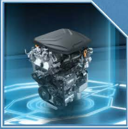
محرك بسعة 1500 سي سي توربو قوة وعزم مع أداء مبهر