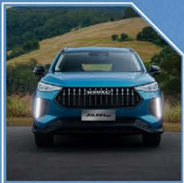
شبكة أمامي مركزي بتصميم شلال عمودي مع مصابيح أمامية LED