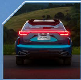
جناح خلفي رياضي منفصل. مصابيح خلفية متصلة بالتصميم