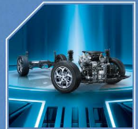
محرك عالي القدرة مطور بالكامل مرتبط بناقل حركة قوي 7DCT