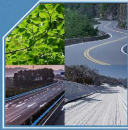
أربعة وضعيات للقيادة الوضع القياسي والإقتصادي والوضع الرياضي؛ وضع الثلج.