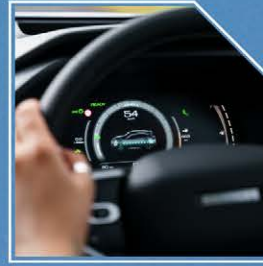
مزودة بنظام الركن التلقائي مع شاشة عرض HUD، شحن لاسلكي، ودعم نظامي Apple CarPlay و Android® Auto.