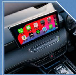
شاشة مزدوجة فائقة الدقة بجسم 12.3 بوصة، عالية الوضوح